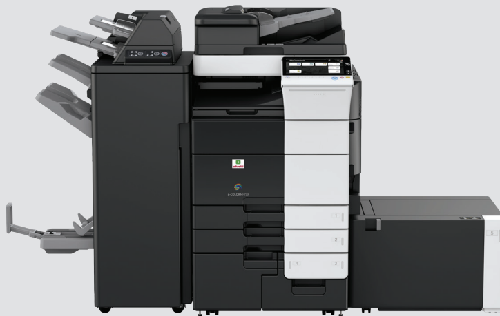
Configuration avec module de finition FS-537SD équipé de l'inserteur hors four PI-507, Pont RU-515 et magasin papier grande capacité latéral LU-205