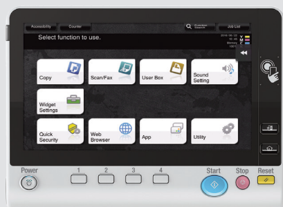
Ecran tactile couleur 10,1 pouces avec authentification NFC